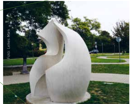
Fotó: Lelkes Márk

megalapította a Nemzetközi Zalaszentgróti Szobrász Alkotótelep és Szimpóziumot, melyet azóta éves rendszerességgel megszervez és koordinál. Önálló alkotásai általában kőből, köztéri szobrai pedig bronzból vannak, s egyedi grafikákat is készít. Témái központjában mindig az ember áll, legyen szó absztrakt vagy figurális alkotásról. Biatorbágyon számos köztéri alkotása megtalálható (Karikó János- és Szimbiózis szobor, kitelepítési emlékmű, Biatorbágy életfája, emléktáblák...) Szervezett túra esetén maga tart tárlatvezetést a műhelyében.