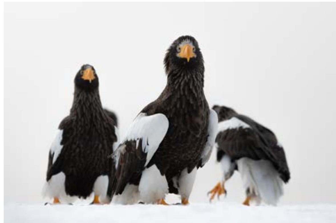
Zih Kata: Triumvirátus

A fenti gondolatok jegyében hívom Önöket egy belső utazásra! Időzzenek el egy-egy alkotással, s próbálják megérezni, a fotós üzenetét.